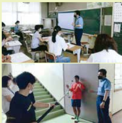
◆千曲市の埴生小学校で不審者侵入訓練が行われた。(千曲署)