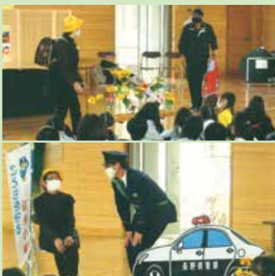
◆諏訪市の中洲小学校で防犯教室が行われた。(諏訪署・少協・自主ボランティア団体)