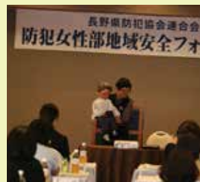
◆塩尻朝日防犯協会連合会 が腹話術を披露