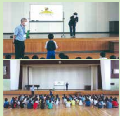
◆下伊那郡高森町の高森南小学校で防犯教室が行われた。(飯田署・スクールサポーター)