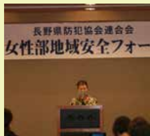
◆諏訪防犯協会連合会 岩波女性部長