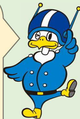
長野県警察シンボルマスコット ライボくん

ID・パスワードだけでログインするのではなく、指紋認証、顔認証、ワンタイムパスワード等、複数の要素でログインをする 多要素認証 を導入してください。