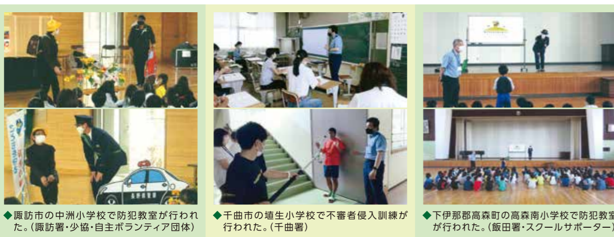
◆諏訪市の中洲小学校で防犯教室が行われた。(諏訪署・少協・自主ボランティア団体) ◆千曲市の植生小学校で不審者侵入訓練が行われた。(千曲署) ◆下伊那郡高森町の高森南小学校で防犯教室が行われた。(飯田署・スクールサポーター)