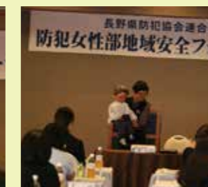
◆塩尻朝日防犯協会連合会 が腹話術を披露