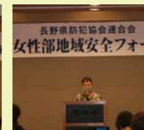
◆諏訪防犯協会連合会 岩波女性部長